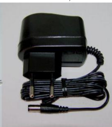
Netzteil 5VDC, medical